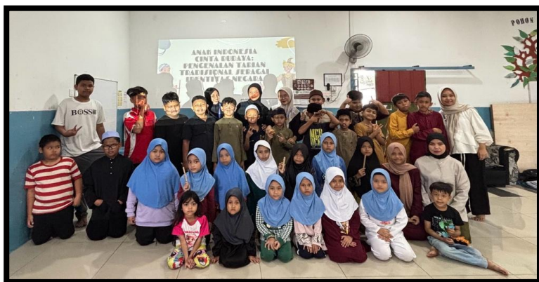
Gambar, 2: Edukasi Gerakan CERDIK: Penyakit Tidak Menular

hami pentingnya pola makan sehat dan seimbang. Selain itu, saya juga mengajarkan mereka tentang penyakit tidak menular, yang diperkenalkan sejak dini agar mereka lebih paham dan dapat menghindari risiko risiko tersebut di masa depan. Materi ini sangat penting agar anak-anak memiliki bekal pengetahuan Kesehatan sejak dini.