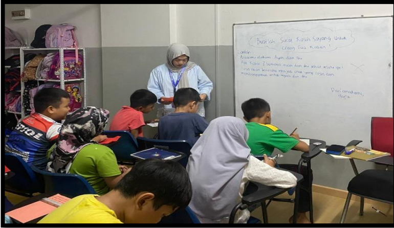
Gambar, 2: Membuat love letter untuk orang tua

Selain program kerja menyanyikan lagu daerah dan membuat love letter untuk orang tua mereka, kami juga melaksanakan beberapa program kerja lain yang bertujuan memperkaya pengetahuan dan pengalaman anak-anak, serta menumbuhkan kecintaan mereka terhadap budaya dan sejarah Indonesia. Salah satunya adalah program terkait Nusantara Indonesia yang bertujuan memperkenalkan keberagaman budaya, tradisi, dan kekayaan alam Indonesia kepada anak-anak. Program ini membuka wawasan mereka tentang identitas dan warisan bangsa yang sangat kaya, sekaligus menumbuhkan rasa bangga sebagai generasi muda Indonesia meski berada di peran-tauan. Kami juga mengadakan workshop kerajinan tangan, di mana anak-anak diajak untuk membuat berbagai macam karya kreatif menggunakan bahan-bahan sederhana. Kegiatan ini tidak hanya melatih keterampilan motorik halus mereka, tetapi juga menstimulasi kreativitas dan rasa