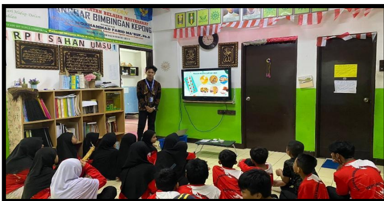
Gambar, 2: Kegiatan Apoteker Cilik

mengenai apa itu kefarmasian, peran penting seorang apoteker, cara menyimpan dan membuang obat dengan baik dan benar, serta berbagai macam bentuk sediaan obat. Dengan metode pembelajaran yang interaktif, anak-anak dapat mengenali bentuk fisik obat, perbedaan kegunaannya, serta cara penggunaannya. Sebagai puncak kegiatan, anak-anak diajak untuk melakukan praktik sederhana pembuatan obat pulveres. Anak-anak merasa antusias dan senang sekaligus mendapatkan pengalaman baru yang bermanfaat, kegiatan Apoteker Cilik ini tidak hanya bertujuan memberikan pengetahuan dasar tentang dunia farmasi, tetapi juga menanamkan kesadaran sejak dini mengenai pentingnya obat, penggunaannya yang bijak, serta tanggung jawab dalam menjaga kesehatan.