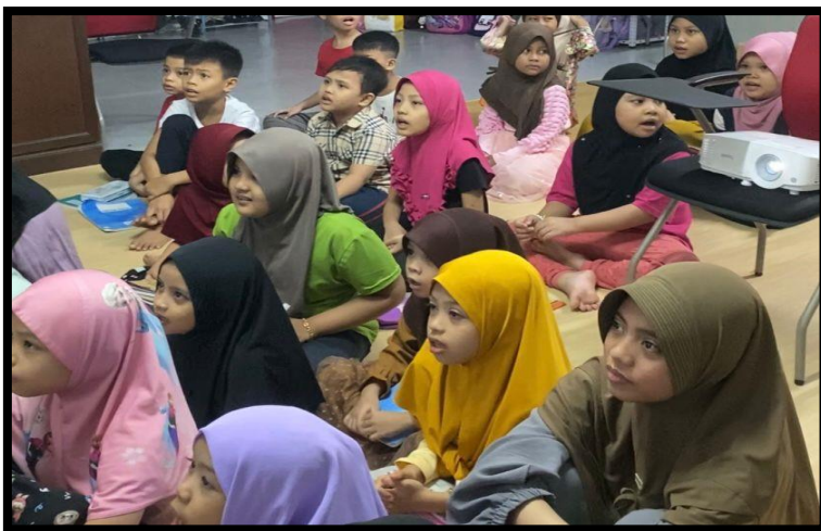
Gambar, 2: Menyanyikan lagu soleram

Kami juga menjalankan program membuat love letter untuk orang tua mereka. Kegiatan ini mengajak anak-anak mengekspresikan rasa sayang dan terima kasih kepada orang tua melalui surat cinta yang mereka tulis sendiri. Program love letter ini tidak hanya melatih kemampuan menulis dan mengungkapkan perasaan, tetapi juga mempererat ikatan emosional antara anak dan orang tua mereka. Melalui surat-surat yang tulis, anak-anak belajar menghargai pengorbanan dan kasih sayang orang tua, sekaligus memberikan momen hangat yang penuh makna bagi keluarga walaupun mereka berada jauh dari tanah air. Kegiatan ini menjadi salah satu wujud konkret dari nilai kasih sayang dan komunikasi yang kami tanamkan selama KKN di Sanggar Bimbingan Subang Mewah