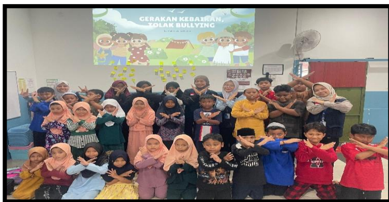
Gambar, 3: Dokumentasi Kegiatan Tolak Bullying

pelajari budaya Indonesia yang kaya dan beragam. Melalui Implementasi Pengenalan Kultur Indonesia dengan Media Game Board, kami memperkenalkan kebudayaan Indonesia secara interaktif. Anak-anak bermain sambil mengenal pakaian adat, rumah tradisional, dan makanan khas dari berbagai daerah. Pada tanggal 1 Oktober, kami memperingati Hari Batik Nasional bersama anak-anak. Mereka dikenalkan pada sejarah, makna motif, dan proses pembuatan batik, kemudian mewarnai pola batik di kertas. Suasana sangat meriah dan penuh kebanggaan, mengingatkan kami semua bahwa batik adalah simbol identitas dan warisan budaya bangsa yang harus dilestarikan.