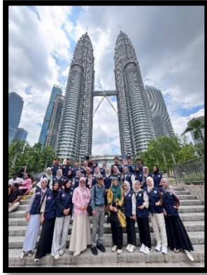
Gambar, 3: Sesi Perfotoan Bersama Dosen Pembimbing

KKN Internasional ini menjadi pengalaman yang sangat berkesan dan penuh makna bagi saya. Saya bangga bisa menjadi bagian dari perjuangan kecil dalam menyalakan semangat belajar dan cinta tanah air bagi anak-anak Indonesia di perantauan. Dari pengalaman ini, saya belajar banyak hal mulai dari tanggung jawab, adaptasi, hingga kerja sama lintas budaya dan kampus. Anak-anak di Sanggar Belajar Kamus mengajarkan saya arti semangat belajar dalam keterbatasan, sementara berbagai pengalaman di luar kelas mengajarkan arti ketangguhan dan kebersyukuran. KKN Internasional ini bukan hanya tentang mengajar dan mengabdikan, tetapi juga tentang belajar menjadi manusia yang lebih sabar, peka, dan peduli. Saya bangga bisa membawa nama Universitas Alma Ata ke kancah internasional, sekaligus menebarkan semangat Indonesia di negeri seberang. “KKN Internasional ini telah mengukir pelajaran berharga bahwa mengabdikan adalah cara terbaik untuk belajar, dan belajar adalah bentuk pengabdian yang tak pernah selesai.”