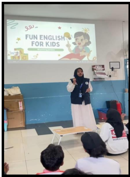
Gambar, 1: Program Kerja Bahasa Inggris

keterbatasan Bahasa dan melihat mereka masih belum pandai dalam menggunakan Bahasa Inggris akhirnya kami memutuskan untuk memberikan ilmu kepada mereka ini.