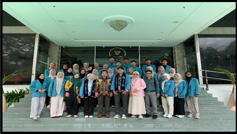
Gambar, 4: Penerimaan Mahasiswa KKNT Internasional 2025 di KBRI

Pada hari itu, kami mahasiswa KKNT Internasional Universitas Alma Ata, berkesempatan mengunjungi Kedutaan Besar Republik Indonesia di Kuala Lumpur sebagai bagian dari program Kuliah Kerja Nyata (KKN). Kunjungan ini memberi kami pengalaman langsung mengenai peran diplomasi dan hubungan internasional. Kami disambut hangat oleh staf kedutaan yang menjelaskan tugas dan fungsi kedutaan dalam melindungi kepentingan Indonesia di Malaysia serta membahas berbagai isu hubungan bilateral. Setelah sesi diskusi, kami berfoto bersama sebagai kenang-kenangan. Pengalaman berharga ini memberikan wawasan baru dan memotivasi kami untuk terus belajar serta berkontribusi bagi bangsa.