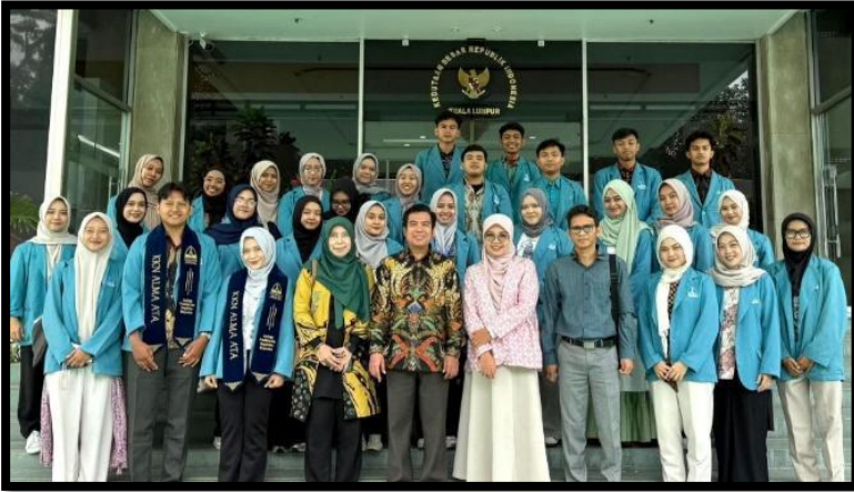
Gambar, 1: Penerimaan Mahasiswa KKN di KBRI

Di Kedutaan Besar Republik Indonesia (KBRI) di Malaysia, kami berdiskusi tentang bentuk pengabdian dengan cara membantu anak-anak Indonesia yang belajar di Sanggar Bimbingan. Keberadaan sanggar ini menjadi penting karena tidak semua anak imigran Indonesia memiliki akses penuh ke sekolah formal di Malaysia. Melalui sanggar belajar, mereka tetap dapat memperoleh pendidikan dasar yang layak, sekaligus mempertahankan identitas budaya dan bahasa Indonesia. Di Universiti Kebangsaan Malaysia, kami berdiskusi dengan dosen-dosen Universiti Kebangsaan Malaysia mengenai sistem pendidikan di Indonesia dan Malaysia. Pertemuan tersebut juga menjadi ruang untuk bertukar gagasan, menjalin jejaring akademik, dan membuka peluang kolaborasi lintas universitas di masa depan. Kedua kunjungan ini memberikan kesan mendalam sekaligus menjadi awal yang baik dalam rangkaian kegiatan KKN-T Internasional 2025