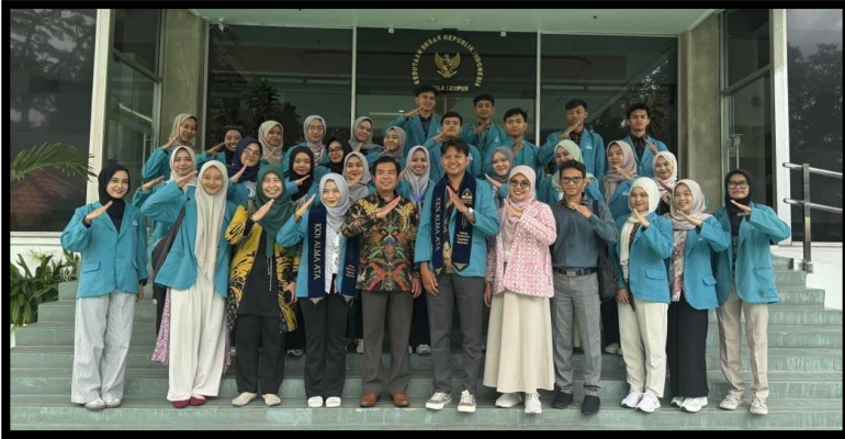
Gambar, 1: Penerimaan Mahasiswa KKN-T Internasional 2025 di KBRI

merasa terhubung dengan lingkungan baru dan siap menjalani tugas pengabdian social selama KKN di Malaysia.