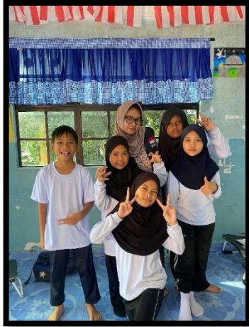
Gambar, 2: Foto bersama murid