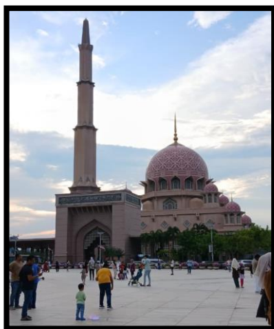
Gambar, 3: Kunjungn Masjid Putra Jaya

Kunjungan selanjutnya yaitu pusat Persekutuan Malaysia yaitu Masjid Putra Jaya hingga mendapatkan julukan “kalau ke Malaysia tak ke Masjid Putra Jaya kurang lengkap” dengan nuansa masjid pink dipinggiran danau. Di pusat Kesultanan Malaysia, indah sekali saat sore hari kesana angin yang sejuk serta awan yang orange. Masjid yang sangat luas serta lapangan yang indah di kelilingi pohon hijau. Medua suara dibilik masjid ini sebelum memasuki waktu sholat Maghrib. Semakin malam semakin indah, ada air panjur di belakang masjid. Sekian dari cerita saya. Jangan pernah menyerah untuk berkarya diluar negeri. Semakin kamu berni semakin kepercayaan diri kamu meningkat. Bye bye terima kasih.