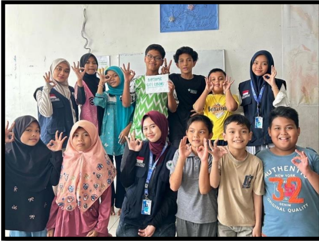
Gambar, 2: Kegiatan Gizi Cerdas

Program yang tak kalah penting yaitu pencegahan infeksi cacing dilakukan melalui edukasi kebersihan dengan ajakan untuk mencuci tangan sebelum makan, menjaga kebersihan makanan dan lingkungan, serta penggunaan alas kaki saat beraktivitas di luar rumah. Program ini penting mengingat infeksi cacing mempengaruhi kesehatan dan perkembangan anak sehingga dapat menghambat proses belajar mereka. Pengalaman mengikuti KKN Internasional 2025 di Sanggar Belajar Srimuda Shah Alam, Selangor, Malaysia merupakan momen yang sangat berharga bagi saya. Selama kegiatan ini, saya tidak hanya belajar banyak tentang budaya dan cara hidup masyarakat Malaysia, tetapi juga mendapatkan pengalaman berharga dalam bekerja sama dan berbagi ilmu dengan anak-anak Sanggar Bimbingan Srimuda.