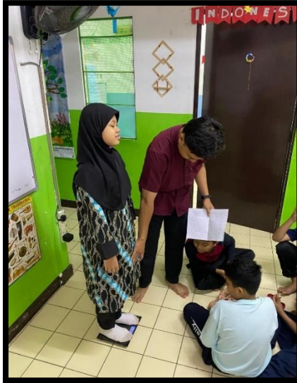
Gambar, 2: Pengukuran IMT pada anak kelas 3-5

Selain kegiatan monitoring status Gizi, saya Bersama rekan tim juga melaksanakan program kerja yang berfokus pada Pendidikan karakter dan pengelolaan keuangan sederhana bagi anak-anak, yaitu “Tabungan Cilik Pintar” program ini bertujuan untuk menanamkan kebiasaan menabung sejak dini, mengajarkan nilai tanggung jawab, disiplin, dan kemandirian kepada anak-anak Sanggar Bimbingan Kepong. Pada program ini kami bersosialisasi tentang pentingnya menabung, dimana anak-anak diajak berdiskusi tentang manfaat menabung dan bagaimana cara menyisihkan uang jajan atau uang pemberian orang tua. Selain itu, kami juga membantu anak-anak dalam berkre-ativitas untuk membuat celengan yang terbuat dari kardus bekas untuk menyimpan uang mereka di rumah. Program