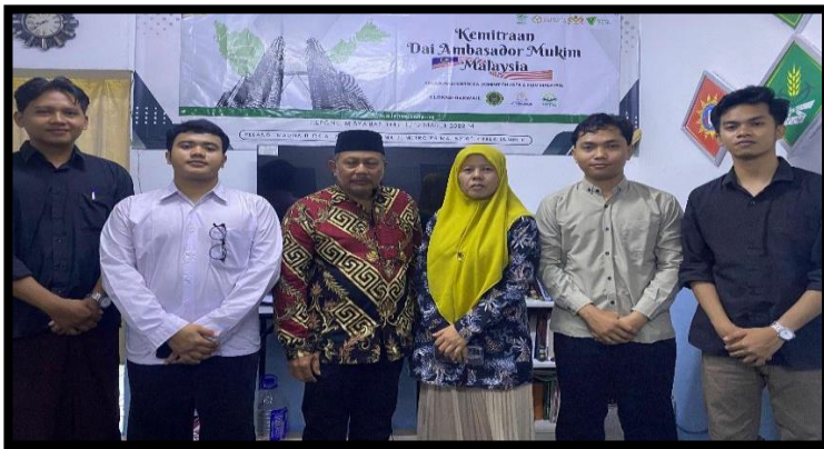
Gambar, 3: Foto bersama pengelola Sanggar bimbingan Kepong