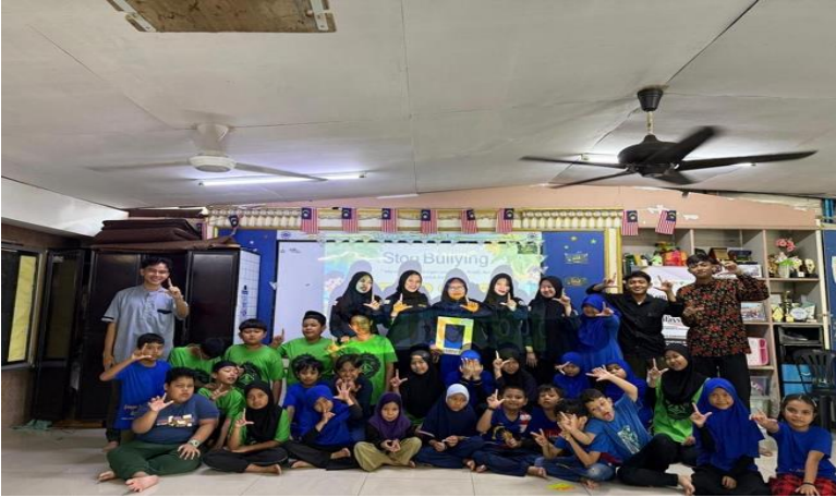
Gambar, 1: Kegiatan