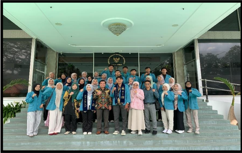
Gambar, 1: Kunjungan Mahasiswa KKN di KBRI

Selama KKN di Malaysia, aku ditempatkan di Sanggar Bimbingan Hulu Langat. Setiap pagi, aku dan teman-teman selalu memulai hari dengan semangat baru. Bangun pagi, bersiap, lalu berangkat untuk mengajar anak-anak SD dan SMP di sanggar. Kami membantu mereka belajar membaca, menulis, dan berhitung. Suasana kelasnya selalu ramai dan seru, tapi tetap menyenangkan. Sekitar pukul 10, kami istirahat untuk makan siang bareng. Setelah energi terisi lagi, kami lanjut ke sesi pelajaran kedua. Anak-anak di sanggar itu benar-benar luar biasa selalu menghormati setiap guru, penuh semangat, dan nggak pernah gagal bikin suasana belajar jadi fun banget. Kadang mereka suka bercanda kecil biar suasananya nggak kaku, tapi tetap sopan dan lucu. Selesai belajar, kami beristirahat sejenak untuk melaksanakan salat berjamaah. Setelah itu, kegiatan berlanjut dengan mengajar mengaji dan memberi hafalan ayat-ayat pendek.