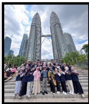
Gambar, 2: Foto Bersama di Twin Tower

Keesokan hari sebenarnya di SB saya terdapat acara perpisahan dengan mahasiswa KKN, namun saat itu bertepatan dengan hari penerjunan KKN di KBRI sehingga kami tidak jadi untuk mengikuti kegiatan perpisahan tersebut. Setelah dari KBRI kami satu rombongan langsung singgah ke Petronas Twin Tower yang dimana kami singgah disini sebelum jam kunjungan ke University Kebangsaan Malaysia. Saat setelah kami mengambil foto dan membuat konten, kebetulan kami satu kelompok SB satu grab untuk