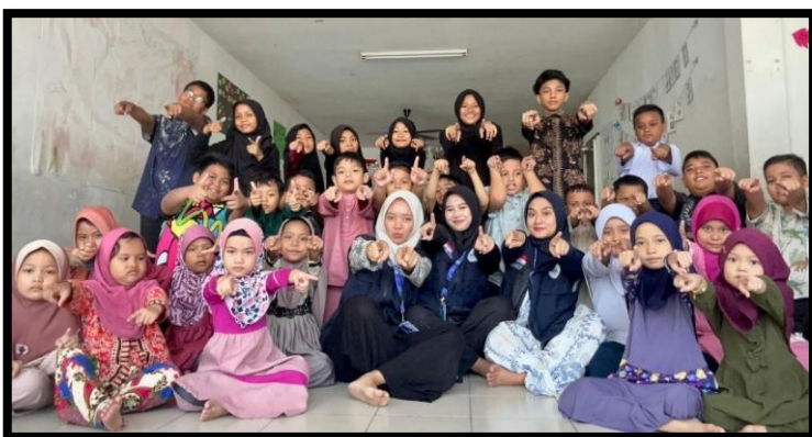
Gambar, 3: Dokumentasi Bersama Anak-Anak Sanggar Bimbingan Srimuda

aspek pendidikan, kesehatan, cinta tanah air hingga kreativitas. Menjadi bagian dari KKN-T Internasional 2025 Universitas Alma Ata Yogyakarta di Malaysia merupakan pengalaman yang sangat berharga, tidak hanya memperluas wawasan akademik, tetapi juga menguatkan rasa kepedulian sosial. Melalui kegiatan KKN di Sanggar Bimbingan Srimuda, saya melihat secara langsung semangat anak-anak dalam belajar meskipun dengan segala keterbatasan yang mereka hadapi. Antusiasme dan kegigihan mereka menjadi sumber inspirasi yang luar biasa, sekaligus pengingat bahwa semangat belajar adalah kekuatan terbesar dalam meraih masa depan. Setiap senyum, tawa, dan rasa ingin tahu yang mereka tunjukkan adalah bukti nyata bahwa program ini mampu menumbuhkan semangat baru, bukan hanya untuk mereka, tetapi juga untuk kami sebagai mahasiswa pengabdian. Lebih dari itu, pengalaman ini mengingatkan bahwa pengabdian bukan sekadar memberi, melainkan juga menerima pelajaran hidup yang tak ternilai.