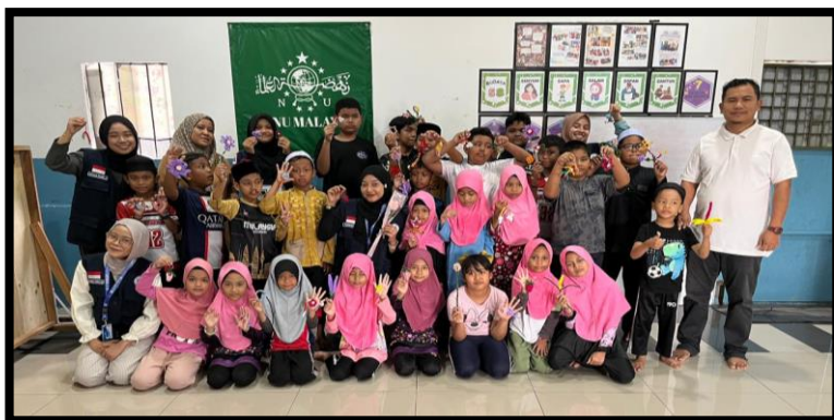
Gambar, 3: Foto bersama kelas 1-5 dalam berkreasi Pipe Cleaner

Selain itu, anak-anak merasa gembira karena karya mereka bisa dibawa pulang atau dijadikan hadiah untuk teman dan keluarga. Dari kegiatan ini, mereka belajar bahwa kreativitas bisa muncul dari bahan sederhana, asalkan mau mencoba dan tidak mudah menyerah.