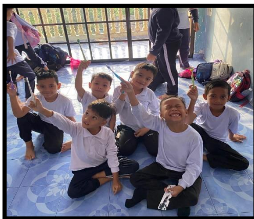
Gambar, 1: Penerapan Kebiasaan Hidup Bersih dan Sehat

Kami mengajar banyak hal disana, mulai dari membaca, menulis, berhitung, hingga kebiasaan hidup bersih dan sehat (PHBS). Tapi saya sadar, mereka bukan hanya belajar dari kami. Justru kami lah yang banyak belajar dari ketulusan dan semangat mereka. Setiap kali kami mengadakan kegiatan, mata mereka berbinar penuh semangat, meskipun dengan fasilitas terbatas.