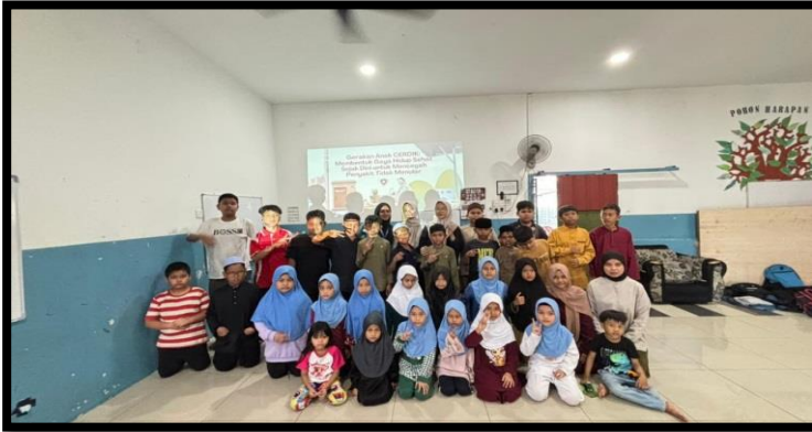
Gambar, 2: Foto bersama dengan kelas 1-5 setelah kegiatan pengenalan permainan tradisional

Selain itu, kami juga mengadakan kelas kreasi yang berjudul Mengasah Daya Cipta Anak melalui keterampilan Kawat Bulu (Pipe Cleaner), kegiatan berkreasi menggunakan kawat bulu berfungsi untuk mengembangkan kreativitas, melatih motorik halus, serta menumbuhkan rasa percaya diri dan kerja sama antar peserta didik. Melalui kegiatan ini, anak-anak belajar mengolah bahan sederhana menjadi karya yang menarik, seperti gantungan kunci, bunga, dan sebagainya, sehingga mereka dapat mengekspresikan ide serta imajinasinya. Tujuan dari kegiatan ini adalah agar peserta didik mampu berkarya dengan keterampilan tangan, bersikap teliti, sabar, dan menghargai hasil karya sendiri maupun orang lain, sekaligus menumbuhkan kegembiraan dalam proses belajar yang kreatif dan menyenangkan. Setelah kegiatan berkreasi menggunakan kawat bulu, anak-anak tampak senang dan bangga dengan hasil karya mereka. Mereka merasa antusias karena bisa membuat gantungan kunci dan bunga dengan bentuk serta