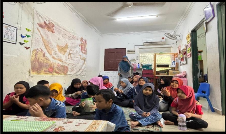
Gambar, 2: Pembacaan Doa Sebelum Program Calistung Dimulai

Aspek spiritual juga menjadi fokus kegiatan kami. Program Tahsin dan Tahfidz Al-Qur'an serta Edukasi Puasa dan Sholat Tarawih menjadi sarana untuk menanamkan nilai-nilai keislaman sejak dini. Melalui kegiatan ini, anak-anak dibimbing untuk membaca Al-Qur'an dengan baik dan benar, serta menghafal surah-surah pendek dengan metode talaqqi dan muroja'ah. Dalam program edukasi ibadah, kami memperkenalkan makna puasa dan tata cara sholat tarawih melalui simulasi dan permainan sederhana. Melihat anak-anak begitu bersemangat mempraktikkan apa yang mereka pelajari menjadi momen yang sangat berkesan bagi saya.