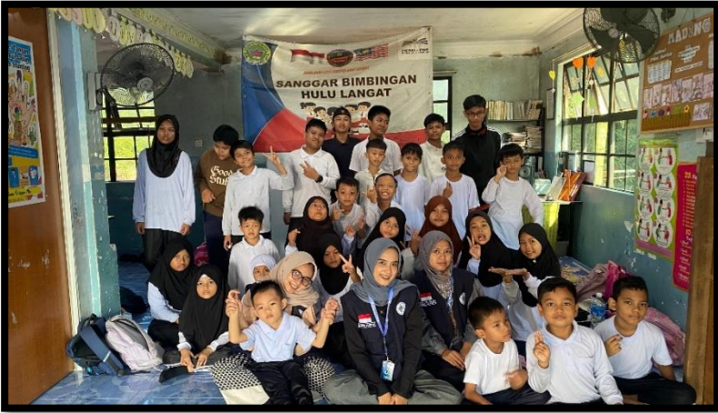
Gambar, 2: Foto Bersama anak-anak SB Hulu Langat

Pengalaman KKN di Malaysia ini benar-bener unforgettable . Banyak hal baru yang aku pelajari, mulai dari budaya, kebersamaan, sampai arti kesabaran dan ketulusan. Terima kasih Malaysia, terima kasih Sanggar Bimbingan Hulu Langat, dan tentunya terima kasih anak-anak lucu yang selalu bikin hariku penuh warna. Itulah sedikit cerita dari aku tentang hari-hari seru selama KKN di negeri jiran. Terima kasih udah mau dengerin pengalaman singkat tapi berkesan ini!