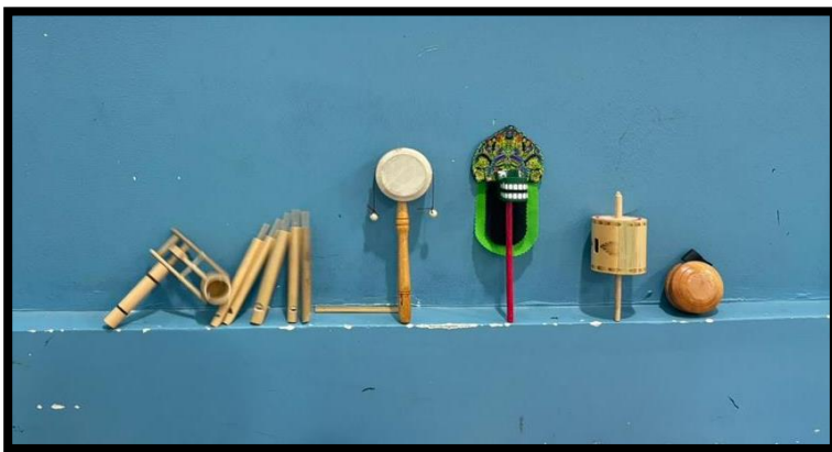
Gambar 1. Permainan Tradisional yang kami bawa dari Indonesia

Mungkin sebelumnya, sebagian dari mereka bahkan belum pernah memainkan permainan tradisional tersebut, sehingga rasa ingin tahu mereka semakij besar. Suasana bermain menjadi ramai dan penuh tawa. Mereka mencoba memutar gasing dengan penuh semangat, beradu ketangkasan memainkan gasing, serta tertawa gembira saat mendengar bunyi khas dari pluit bambu. Pada permainan barongan mini caplok, mereka larut dalam gerak dan keseruan saat saling mencoba menggerakkan mulut barongan. Melalui pengalaman ini, anak-anak tidak hanya bersemang-senang, tetapi juga belajar bekerja sama, menghargai budaya, dan menumbuhkan rasa bangga terhadap permainan tradisional Indonesia.