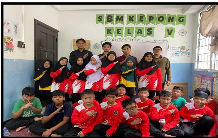
Gambar, 3: Foto Bersama setelah kegiatan

ini memberikan Pelajaran berharga tentang bagaimana nilai nilai kecil dapat menumbuhkan perubahan besar dalam pola pikir anak-anak. Melihat mereka begitu semangat menabung dan bangga menunjukkan hasilnya menjadi momen yang sangat Bahagia bagi kami. Program yang kami buat sederhana ini menjadi bukti bahwa pengabdian tidak selalu harus besar, asalkan dilakukan dengan niat tulus dan memberi dampak positif bagi orang lain.