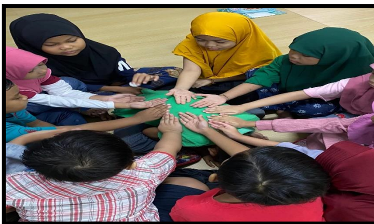
Gambar, 1: Praktek permainan Cublak - Cublak Suweng

Kami juga mengadakan kegiatan Memperkenalkan Permainan Tradisional “Cublak-Cublak Suweng”. Melalui pemutaran video musik dan praktik langsung, anak-anak belajar makna kebersamaan dan budaya lokal. Suasana begitu hidup dan penuh tawa, menunjukkan betapa permainan tradisional masih memiliki tempat di hati generasi muda.