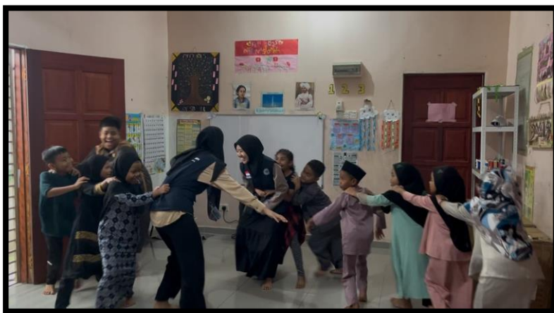
Gambar, 1: Mengenalakan Permainan Tradisional

Saya merupakan salah satu perwakilan dari Universitas Alma Ata, dan hanya berdua dari kampus kami sama-sama mahasiswa semester 5. Di Malaysia, kami digabung dengan teman-teman KKN dari UIN Sunan Ampel Surabaya yang sebagian besar sudah semester 7. Walaupun berasal dari kampus dan latar belakang yang berbeda, kami bekerja sama dengan baik dalam melaksanakan kegiatan dan membantu program yang telah disusun oleh pengurus Sanggar Belajar Kamus. Selama satu bulan KKN, kami menjalankan berbagai program kerja (proker) yang bertujuan memperkenalkan Indonesia dan budayanya kepada anak-anak PMI. Program yang kami bawa antara lain pembuatan kolase dari beras berbentuk burung Garuda sebagai simbol negara Indonesia, serta pengenalan permainan tradisional seperti ular naga panjangnya dan dakon. Melalui kegiatan ini, kami ingin menanamkan rasa bangga dan cinta tanah air pada anak-anak, agar mereka tidak melupakan identitas Indonesia walau hidup di luar negeri.