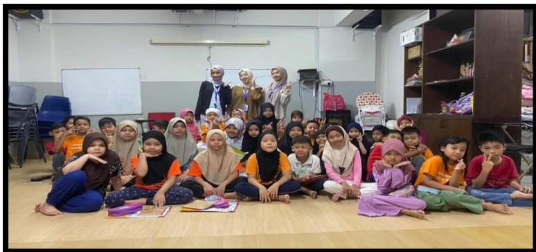
Gambar, 2: Foto bersama setelah bernyanyi bersama lagu Soleram

Kegiatan lain yang tidak kalah menarik adalah Storytelling Pahlawan Indonesia. Kami membawakan kisah perjuangan Tan Malaka dengan cara interaktif. Anak-anak mendengarkan dengan penuh semangat dan di akhir kegiatan, kami mengadakan kuis kecil. Dua anak yang berhasil menjawab pertanyaan dengan benar mendapatkan hadiah sederhana, namun kebahagiaan mereka luar biasa. Melalui program Edukasi Mengenal Keragaman Budaya Indonesia, kami memperkenalkan lagu daerah Soleram yang berasal dari Riau. Anak-anak menyanyikan lagu tersebut dengan semangat, bahkan setelah kegiatan berakhir, beberapa dari mereka masih terdengar menyanyikannya sambil bermain.