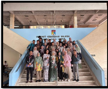
Gambar, 2: Foto bersama di UKM

Kami tinggal di tempat yang disediakan oleh pihak sanggar, dan saya merasa bersyukur karena tempatnya sangat nyaman. Kamar kami sudah dilengkapi AC, kamar mandi dalam, serta dapur bersama yang bisa digunakan untuk memasak. Dapurnya juga cukup lengkap dengan berbagai perlengkapan, jadi kami bisa memasak makanan sendiri di sela-sela kegiatan. Memang, tidak tersedia jaringan Wi-Fi, tetapi alhamdulillah saat tiba di Bandara KLIA kami sudah membeli paket internet untuk satu bulan, sehingga komunikasi dengan ustazah sanggar maupun dengan orang tua di Indonesia tetap berjalan dengan lancar.