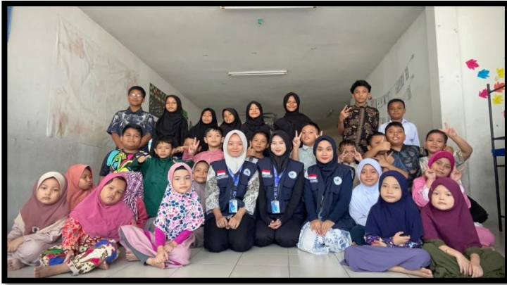
Gambar, 1: Memperingati Hari Batik Nasional

Kami juga melaksanakan program Apocil (apoteker cilik), kegiatan ini bertujuan untuk mengenal lebih dekat dunia farmasi, mulai dari pengenalan profesi apoteker, penggolongan obat, pengenalan berbagai bentuk sediaan farmasi, dan praktik langsung membuat salah satu bentuk sediaan obat yang sering digunakan untuk anak-anak, yaitu sediaan pulveres.