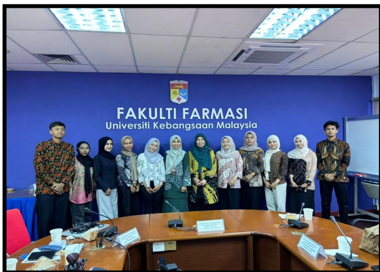
Gambar, 2: Kunjungan Mahasiswa KKN Farmasi di UKM

dan membuka peluang kolaborasi lintas universitas di masa depan. Kedua kunjungan ini memberikan kesan mendalam sekaligus menjadi awal yang baik dalam rangkaian kegiatan KKN-T Internasional 2025 Universitas Alma Ata. Dari sini, saya belajar bahwa pengabdian bukan hanya soal memberikan ilmu, tetapi juga membangun hubungan, saling memahami, dan bekerja sama untuk kemajuan bersama.