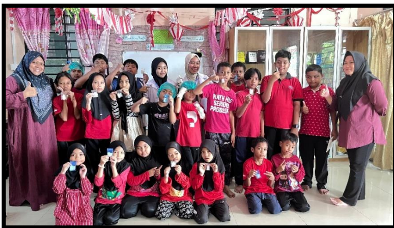
Gambar, 2: Pengenalan Obat dan Profesi Apoteker

Selain itu, saya sebagai rekan dari Program Studi Farmasi melaksanakan proker pengenalan obat dan profesi apoteker, serta pembuatan hand sanitizer sederhana. Anak-anak diajarkan pentingnya menjaga kebersihan tangan dan mengenal peran apoteker dalam dunia kesehatan. Sementara partner saya dari Prodi Gizi melaksanakan program GGL (Gula, Garam, Lemak) yang mengajarkan anak-anak pentingnya menjaga keseimbangan gizi, serta kegiatan fun cooking membuat salad buah yang berlangsung dengan sangat seru dan interaktif.