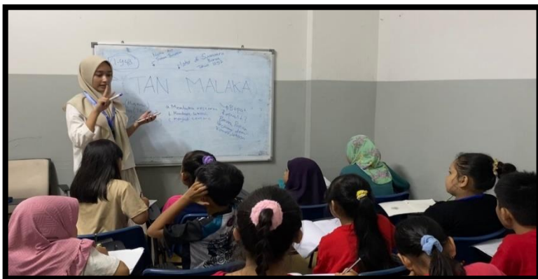
Gambar, 1: Story Telling Pahlawan Indonesia

Dalam periode KKN kami dari tanggal 19 September sampai 14 Oktober 2025, kami melaksanakan beberapa program kerja di Sanggar Bimbingan Subang Mewah. Program utama kami meliputi kelas bahasa Indonesia, matematika, ilmu pengetahuan alam, ilmu pengetahuan sosial, pendidikan kewarganegaraan, seni budaya, dan diniyah. Selain itu, kami juga mengukung program-program unggulan seperti storytelling pahlawan Indonesia, edukasi keragaman budaya Indonesia, workshop kerajinan tangan, edukasi kesehatan sederhana, dan praktik membuat cemilan sehat.