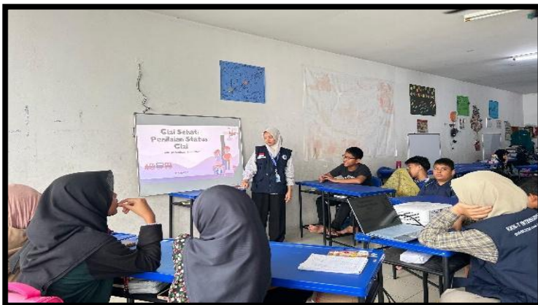
Gambar, 3: Program Status Gizi Sehat

depan. Setiap hal kecil yang terjadi di hidup kita, itu akan berdampak, baik saat ini maupun di masa depan, baik bagi diri sendiri maupun bagi orang lain. Perubahan besar dimulai dari hal-hal kecil, layaknya bunga tak langsung mekar, bermula dari biji kecil yang setia menunggu waktunya.