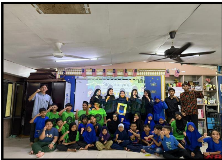
Gambar, 2: Kegiatan Sosial "Stop Bullying"

Di sanggar ini, saya mengajar beberapa mata pelajaran. Selain itu, saya juga ikut terlibat dalam kegiatan pendampingan belajar Bahasa Indonesia, pelatihan membaca Al-Qur'an, serta kegiatan kreatif seperti menggambar, hingga pelatihan seni angklung bersama anak-anak. Setiap hari, kami berusaha menghadirkan suasana belajar yang menyenangkan dan bermakna, agar anak-anak tetap semangat menuntut ilmu meskipun dengan keterbatasan sarana dan waktu belajar. Seluruh pengalaman ini menjadi pelajaran berharga bagi saya, baik dari sisi akademik maupun sosial. Melalui interaksi langsung dengan siswa-siswi dan masyarakat sekitar yang ada di Malaysia, kami belajar untuk lebih peka terhadap permasalahan sosial dan mencari solusi yang tepat. Pengalaman saya menjalani KKN Tematik Internasional di Malaysia, tepatnya di Sanggar