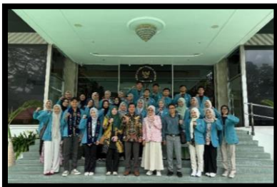
Gambar, 1: Penerimaan Mahasiswa KKN di KBRI