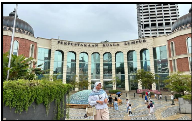
Gambar, 2: Kunjungn Perpustakaan Kuala Lumpur

akan terus memperkenalkan kemereka bagaimana keadaan Indonesia dan lingkungan disana. Ada salah satu tempat yang membuat saya tersanjung yaitu dataran Merdeka dan perpustakaan pusat Malaysia. Dengan keindahan alamnya serta bangunan yang unik. Bertemu dengan berbagai daerah dari Panca Negara. Dalam hati saya ternyata dunia sangat indah dan luas.