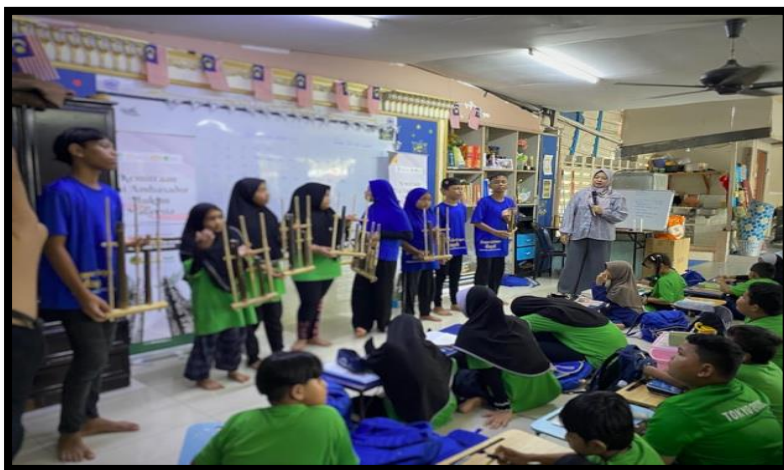
Gambar, 10: Penampilan Angklung

nada-nada bambu itu bergema di Sanggar Bimbingan, saya merasa seakan suara Indonesia hadir di tengah kota Kuala Lumpur. Mereka tampil dengan penuh percaya diri, dan sorot mata mereka menunjukkan kebanggaan menjadi anak Indonesia, meski hidup di negeri orang. Dari situ saya belajar bahwa pendidikan tidak hanya membentuk pengetahuan, tetapi identitas dan kebanggaan nasional.