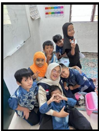
Gambar, 3: Kebersamaan Dengan Sebagian Anak-Anak

alami seperti kunyit, daun serai, dan jeruk nipis banyak anak-anak yang bertanya “memangnya kita mau memasak ya ibu?” karena anak-anak tau kalau saya berasal dari prodi Gizi yang menyangkut pautkan dengan memasak, padahal untuk membawa bahan alami itu untuk mengajari anak-anak untuk terbiasa mengonsumsi bahan alami saat kondisi badan sedang drop.