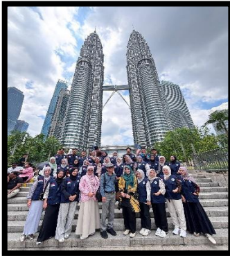
Gambar, 1: Foto bersama di menara petronas