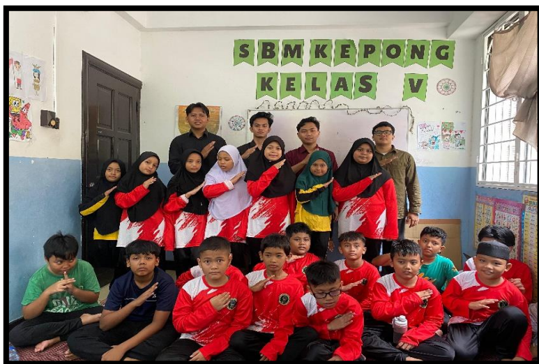
Gambar, 2: Foto Bersama Kelas 3-5 SB Kepong

saya juga jarang melihat warga asli melaysia di daerah ini. Berbicara mengenai kondisi ekonomi, di daerah sanggar bimbingan kepong ini para imigran sudah menetap bertahun-tahun karena tuntutan pekerjaan. Begitu juga para orang tua dari anak-anak yang sekolah di sanggar bimbingan kepong mereka bekerja dan menetap di daerah ini demi mencari nafkah bagi keluarganya. Salah satu faktor mengapa banyak para imigran yang memilih untuk tinggal dan hidup di negeri jiran ini adalah tuntutan kebutuhan yang harus dipenuhi karena salah satu faktornya adalah kegagalan pemerintah dalam menciptakan lapangan pekerjaan bagi Rakyatnya sendiri.