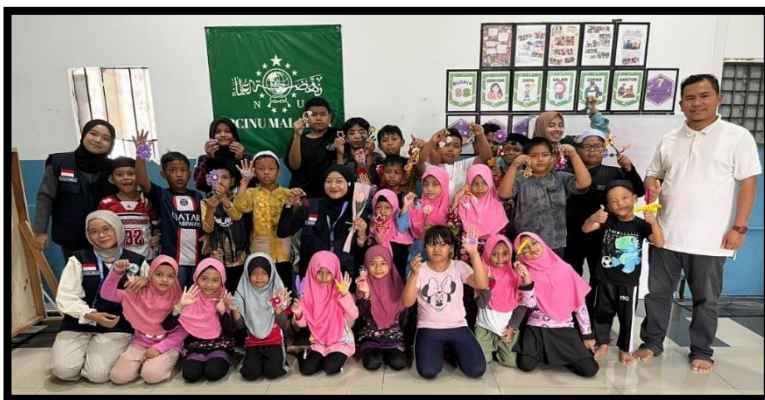
Gambar, 2: Dokumentasi Kegiatan Kreasi Kawat Bulu

Dasar Matematika Bisnis (Menabung) dan Aku Cerdas Mengelola Uang: Literasi Keuangan Dasar, di mana anak-anak belajar memahami nilai uang dan pentingnya kebiasaan menabung untuk masa depan. Suasana kegiatan selalu hangat dan penuh semangat, menjadikan proses belajar terasa menyenangkan dan bermakna.