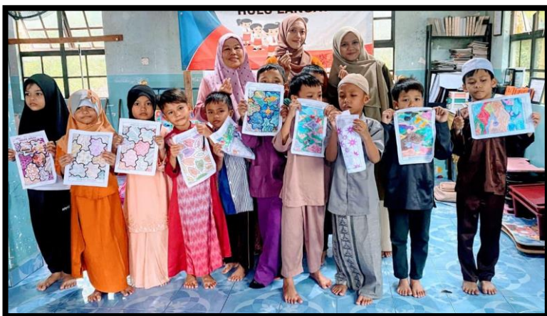
Gambar, 2: Mewarnai batik bersama

Bagian paling berkesan dari kegiatan ini adalah pengenalan budaya Indonesia kepada anak-anak di Malaysia. Kami ingin mereka mengenal lebih dekat tentang negeri kami, bukan dari buku tetapi lewat pengalaman langsung. Kami juga memperkenalkan lagu-lagu daerah seperti “Ampar- Ampar Pisang dan Cublak-cublak suweng”, yang langsung mereka sukai karena nadanya riang dan mudah diingat. Selain itu, kami juga memperkenalkan tarian tradisional. Dan saya pribadi, mengenalkan beraneka ragam macam batik yang ada di Indonesia melalui kegiatan mewarnai batik bersama.