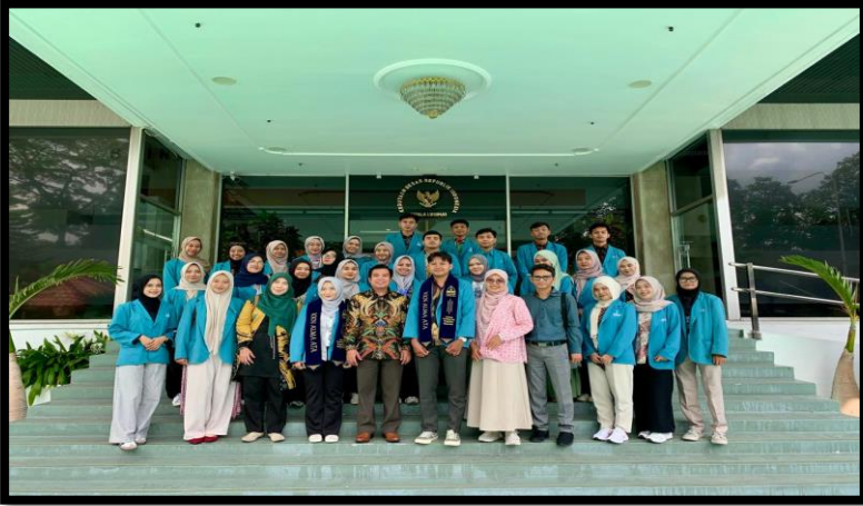
Gambar, 1: Penerimaan Mahasiswa KKN di KBRI

di Malaysia adalah mengunjungi Kedutaan Besar Republik Indonesia (KBRI) di Malaysia dan mengunjungi Universiti Kebangsaan Malaysia.