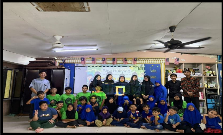
Gambar, 2: Foto Bersama KKN UAA Bersama Anak SB

Untuk memastikan keberagaman materi dan dampak yang luas, kami merancang empat program kerja (proker) utama yang berfokus pada berbagai aspek perkembangan anak: