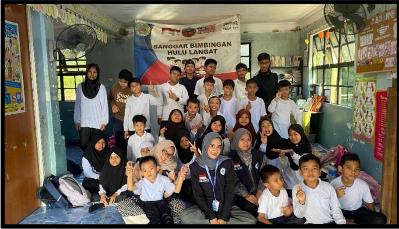
Gambar, 1: Kebersamaan dengan murid sb hulu langat

Saat pertama kali tiba di Hulu Langat, suasana kampung yang asri dan masyarakat yang ramah langsung menyambut kami. Selama menjalani KKN di Sanggar Bimbingan Hulu Langat, Malaysia saya belajar bahwa kebersamaan tidak selalu berarti kesamaan justru dari perbedaan budaya banyak pengalaman dan pelajaran berharga yang saya dapatkan. Mulai dari proses adaptasi, kebersamaan dengan anak-anak sanggar di sanalah anak-anak belajar membaca, menulis, berhitung, dan mengenal nilai-nilai kehidupan. Setiap hari setiap kali kami datang, anak-anak menyambut dengan antusias, kami mengajar dengan cara yang menyenangkan menggunakan permainan edukatif, lagu anak, dan gambar warna-warni. Selain pelajaran dasar, kami juga menyisipkan materi PHBS (Perilaku Hidup Bersih dan Sehat) seperti cara mencuci tangan yang benar, menjaga kebersihan lingkungan, dan pentingnya menggosok gigi 2 kali sehari.