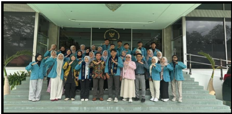
Gambar, 5: Penerimaan Mahasiswa KKN di KBRI

tidak hanya berbagi ilmu tetapi juga untuk menumbuhkan semangat belajar dan cinta tanah air di kalangan anak-anak imigran.