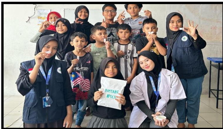
Gambar, 2: Dokumentasi Kegiatan Apoteker Cilik

Setiap hari bersama mereka adalah pengalaman yang membuka hati, dan mengingatkan saya betapa pentingnya kesempatan untuk belajar bagi setiap anak, di mana pun mereka berada.