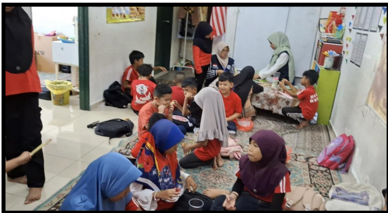
Gambar, 1: Proses Pembuatan Minuman Herbal Seruni

Selama menjalani KKN, kami berfokus pada beberapa program utama yang saling berkaitan. Sebagai mahasiswa Farmasi, saya bertanggung jawab dalam program Edukasi Herbal Sehat. Melalui program ini, saya memperkenalkan berbagai tanaman herbal yang mudah ditemukan dan memiliki manfaat bagi kesehatan. Kami mengajarkan anak-anak cara membuat minuman herbal sederhana bernama Seruni, yang merupakan singkatan dari serai, kunyit, dan jeruk nipis. Anak-anak sangat antusias mengikuti kegiatan ini karena dapat belajar sambil mempraktikkan langsung cara pembuatan minuman tersebut. Mereka juga mencicipi hasilnya dan mengetahui manfaatnya bagi tubuh, seperti menjaga daya tahan dan membantu pencernaan. Program ini tidak hanya memberikan edukasi kesehatan, tetapi juga menumbuhkan kesadaran akan pentingnya bahan alami sebagai alternatif hidup sehat.