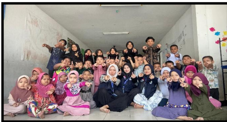
Gambar, 4: Foto Bersama Anak-anak SB Srimuda